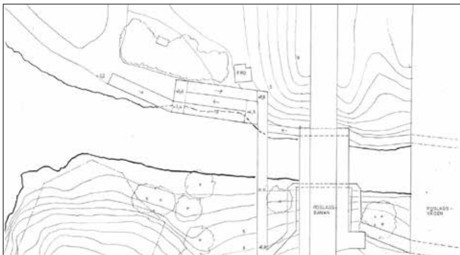
Förslag till ny gångbro över Ålkistan. Norr uppåt.