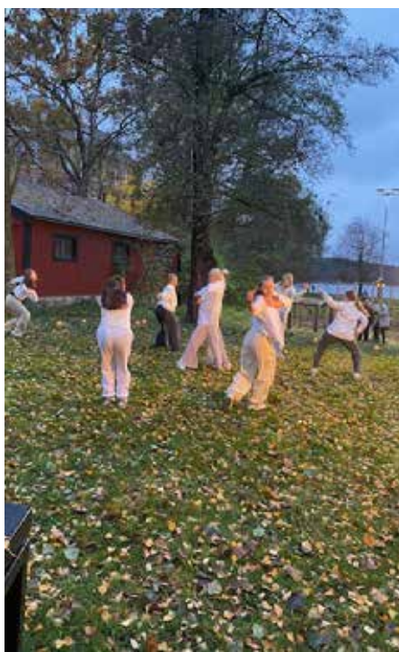
Ljusfesten vid Vårdshuset Kräftan