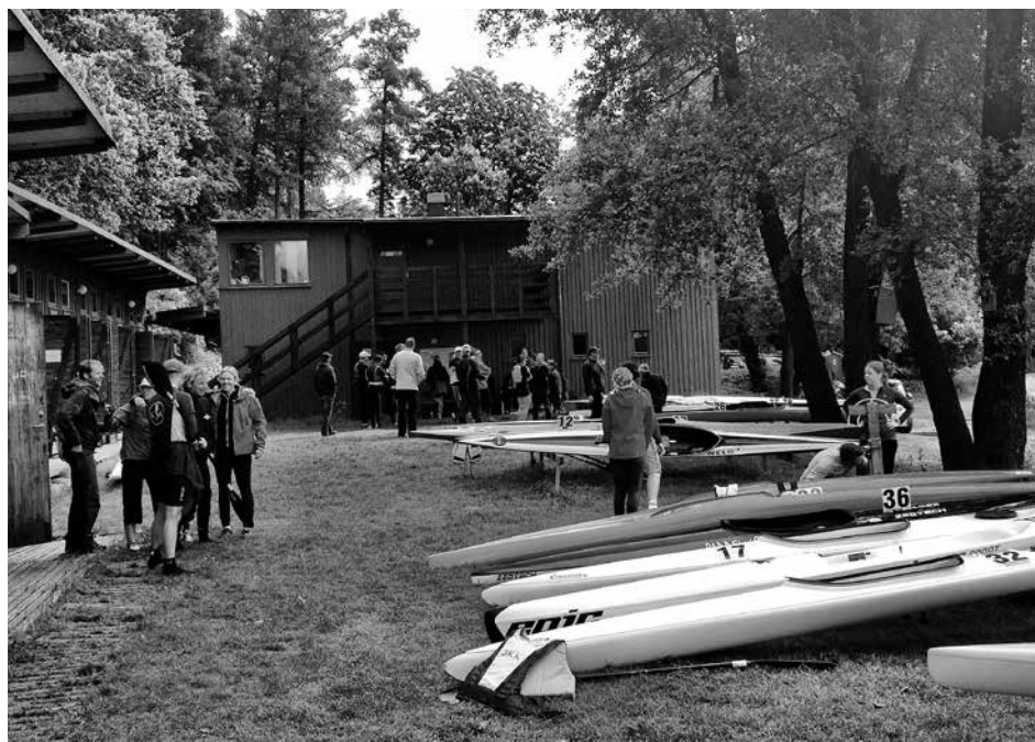
Full aktivitet utanför BKK:s klubbhus.

Historiken bygger på uppgifter från Eva Berglund-Lindbäck. Läs vidare på föreningens bemsida, www.bkk.se/