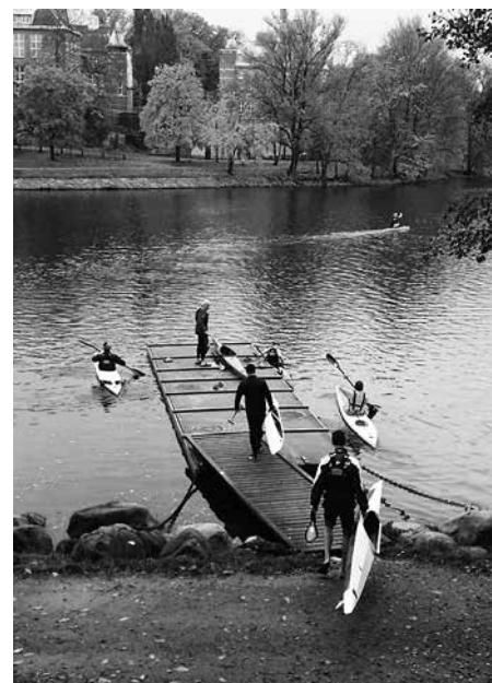
Paddling förknippas gärna med sommaren, men i stort sett året runt glider kajakerna ut på Brunnsviken. Här en höstlig utfärd 2012.

Brunnsvikens Kanotklubb har också under de senaste åren medverkat i de arrangemang som Haga-Brunnsvikens vänner ordnar årligen kring Brunnsvikens vatten. Under Hagadagen har vi haft gratis prova-på-paddling och cafeteriaförsäljning. Brunnsvi-