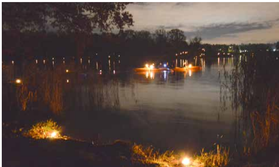
Marschaller och kanoter. Flackande ljuspunkter stryker fram över Brunnsvikens vatten.

Det finns ett liv och en upplevelse bortanför Djurgården och Gärdet, vill man säga till alla stockholmare. Här har föreningens medlemmar en uppgift, att vara ambassadörer för vår verksamhet och för vad den erbjuder, liksom att värva medlemmar.