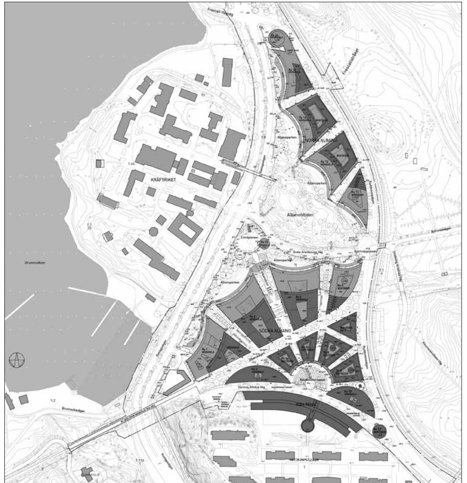
Planer för nybygge i Albano. De mörka och mellangrå silhuetterna anger ny bebyggelse, med undantag av det redan stående Fysikcentrum, nederst. Till vänster Brunnsviken och Kräftriket. Ritningar ur gestaltungsprogrammet Albano – Stockholms nya universitetsområde, Stockholms stadsbyggnadskontor 2012. Planhandlingarna kan studeras på www.stockholm.se/sbk .

Av den totala nybyggnadsmassan på 150 000 kvadratmeter utgörs 100 000 av lokaler, 50 000 av studentbostäder, motsvarande ca 1 000 lägenheter. Akademiska hus och stadsbyggnadsnämnden har tidigare begärt en höjning till 1 500 lägenheter, vilket dock avvisas av Stadsbyggnadskontoret. Istället vill kontoret utreda hur Kräftriket mellan Roslagsvägen och Brunnsviken kan förtätas med 500 bostäder. Kräftrikets glesa bebyggelse med "hus i park" i lummig grönska har av kritikerna framhållits som en god förebild för Al-