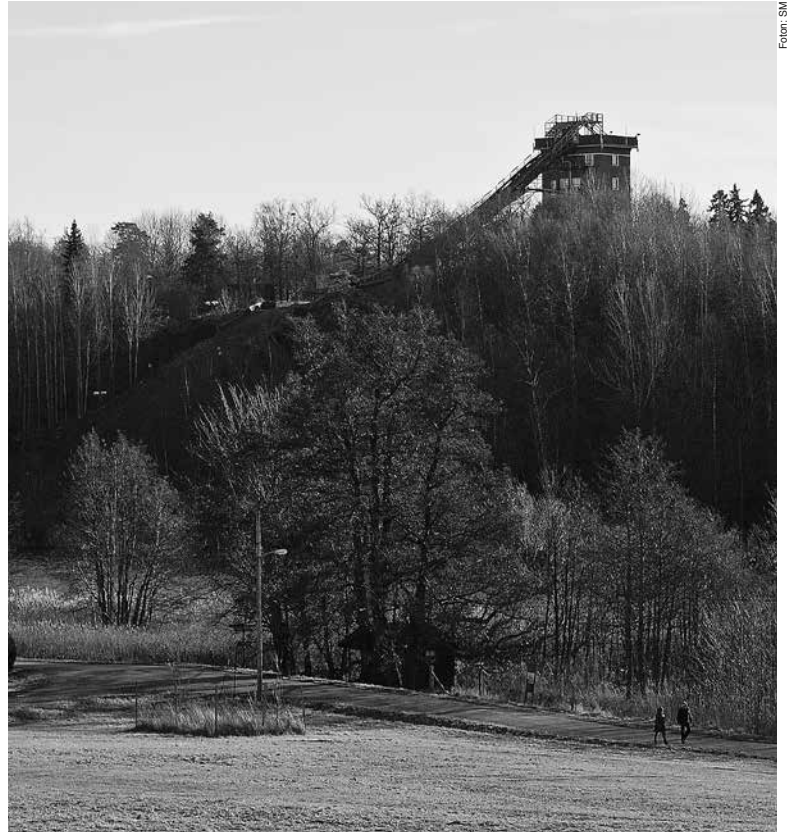
Paviljongen vid Ugglevikskällan. En populär rastplats, men några skopor att dricka källvatten med finns inte längre. Till höger: Fiskartorpet med det stora hopptornet sett från Stora Skuggan.

så symboliskt laddad pusselbit i både idrotts- och friluftshistorien. Den utgör nämligen en materiell markör för inledningen av en historieskrivning som så småningom landar i både utvecklingen av Friluftsrörelsen och de olympiska spelen i Stockholm år 1912. Här spelar nämligen Fiskartorpets tillblivelse en roll. Mer om det kan man läsa i ett kapitel av undertecknad i boken Friluftshistoria: från "härdande friluftsliv" till ekoturism och miljöpedagogik: teman i det svenska friluftslivets historia .