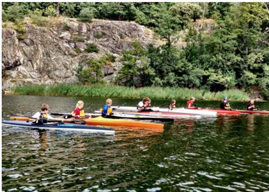
Unga kanotister från Brunnsvikens kanotklubb i fin formation.

tävlingen på Brunnsviken men även långfärdspaddling förekom. 1933 paddlade 2 medlemmar till Öland via Västervik tur och retur. Då fanns 35 paddelkanoter i klubben.