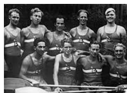
Klubben har paddlat hem åtskilliga medaljer genom åren. Här ett seg-rarlag från 1947.

Nytt kanotmagasin byggdes med hjälp av medlemmarna (då 239). När allt var klart skulle Vägverket i samband