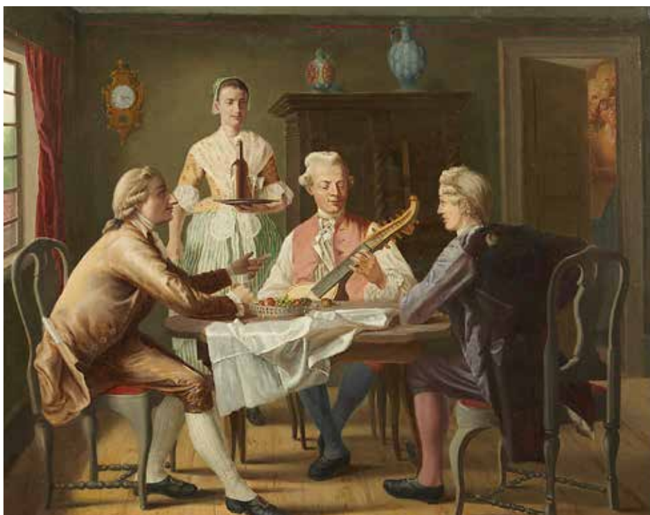
En okänd konstnär bar i en oljemålning föreställt sig Bellman och hans vänner på värdshusbesök. För Bellman har han använt ett känt porträtt från 1779 av Per Krafft d.ä. som förlaga.