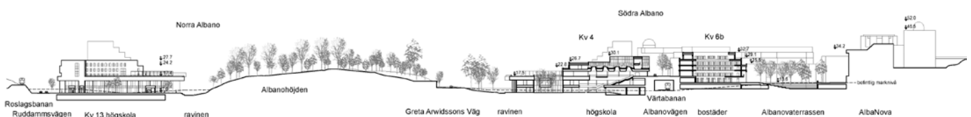
Genomskäring av området med Fysikcentrum längst till höger, Roslagsbanan till vänster. I det aktuella förslaget är Värtabanen överdäckad.