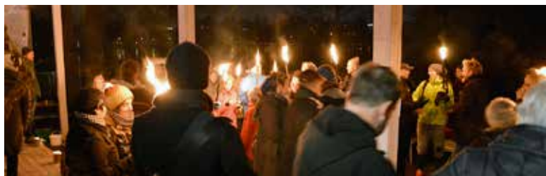
Fackelbärare vid Kafé Sjöstugan, Ljusfesten 2012.

Hagabladet vill som alltid både uppliva minnen från förr och fånga nuet och framtiden. Med avstamp i årets Hagadag den 18 augusti söker vi spåren efter Carl Michael Bellman på Haga. Närmare i tiden ligger den bioaktuelle Olof Palmes relationer till Norra Djurgården. Snabba kanoter ger liv åt Brunnsvi-