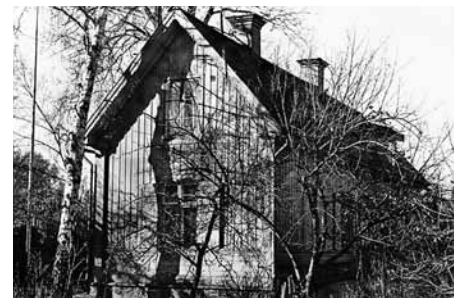
Linvävartorpet som det tedde sig 1966. Huvudbyggnaden revs året därpå, i samband med breddning av Uppsalavägen/E4:an.