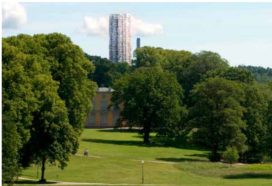
Ny märkesbyggnad för Haga och Nationalstadsparken? Förslag till högbus i Värtan. Montage hämtat ur fördjupad miljökonsekvensbeskrivning för detaljplan, Norra Djurgårdsstaden.

Men stadsbyggnadskontoret kom igen. I det utställda planförslaget sänkte man tornet med tio meter, gjorde helt om marsch och gav tornet den nya meningen att "markera stenstadens slut". (Oklart om pylonen av-