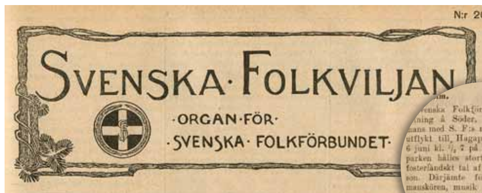
Svenska Folkviljan var Svenska Folkförbundets tidning. Förbundet var försvarsvänligt och antisocialistiskt. Tidningen annonserade om mötet 1909 i Hagaparken. För 50 öre fick besökarna lyssna på fosterländskt tal och sång av förbundets manskör.

Riksmarskalken stod dock fast vid sitt beslut, och det slutade med att vänsterkommunen i stället fick söka sig till platser som Vitbergsparken på