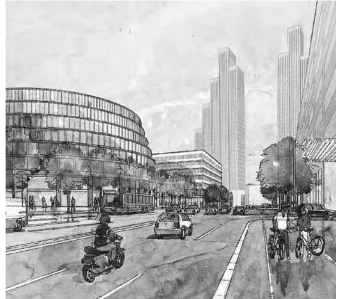
Tors torn i samrådsförslaget 2009 respektive gällande detaljplan.

»»» senast presenterade handlingarna i Norrtullsplaneringen är det inga märkesbyggnader från det tjugoförsta seklet som ska "definiera entrén till Norrtull" och Stockholm – utan 1733 års blygsamma tullstugor.