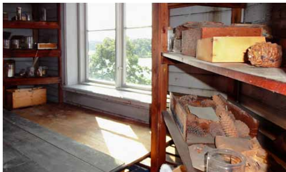
Kottar från hela Sveriges samsas på hyllorna längs tornets vinklade väggar, insamlade och katalogiserade av Veit Wittrock. Brunnsviken skimtar utanför.

Referens: Wittrock V B 1914. Meddelande om granen, särskildt hennes svenska former, i bild och skrift. Acta Horti bergiani. Band 5 (nr 1) 1–91.