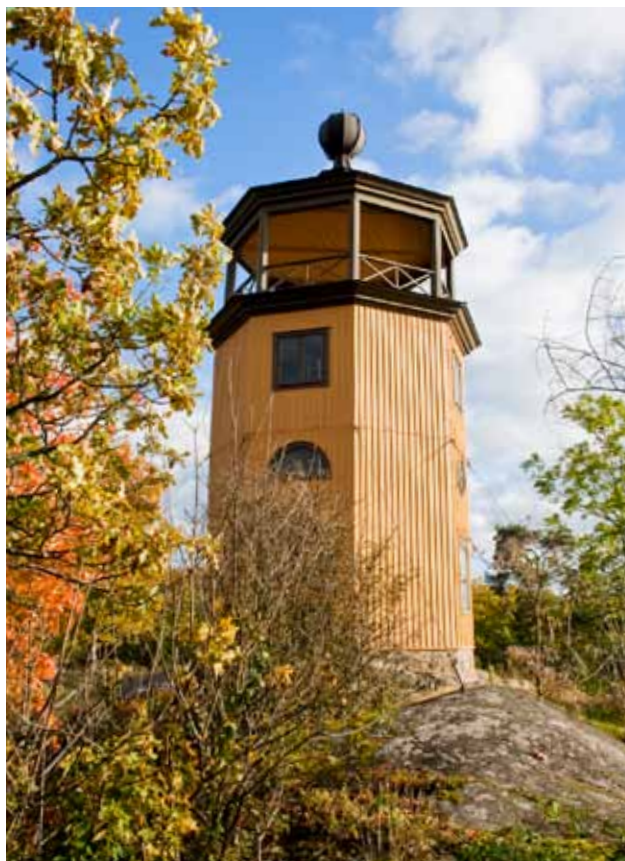
Överst på bergsknallarna höjer sig tornet vid Bergianska. Tre trappor upp når man utsiktsplattformen.

Härvidlag var kottar ett av hans stora intressen! Från alla hörn i Sverige bad han om bidrag till sin kottsamling och man förstår att prost och adjunkt i minsta församling har vandrat i skogen för att samla kottar till professorn i