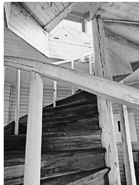
Uppåt, uppåt. Till charmen med ett gammalt torn hör att räkna de knarrande trappstegen. Här skymtar utsiktsterrassen i Bergianska trädgårdens torn.

Tornet i trädgården har genom tiderna sett olika ut. Den österländska pagoden byggdes ursprungligen i anslutning till ett buddhistiskt tempel och kännetecknas av att alla våningsplan