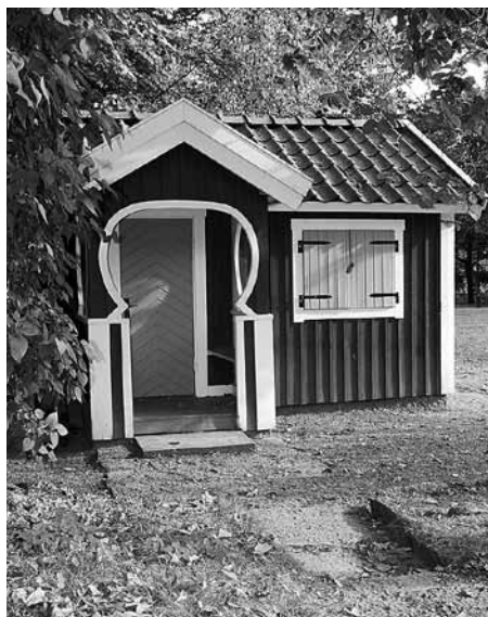
Lekstugan, skänkt av Gustav V, i väntan på att slå upp fönsterluckorna för nästa kull.

Restaureringen karakteriserades av storslagen enkelhet. Funktionalismens krav på strikthet förverkligades