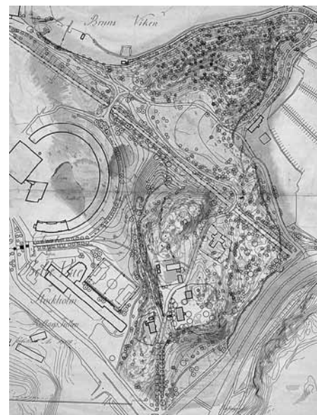
Kartöverlägg. Ovanpå en karta från 1809 över Bellevue har lagts dels senare ingrepp, utfyllnader och byggnader, dels förslagsskiss till åtgärder. Ur "Bellevueparken – program för utveckling av parken", 2009-04-14.