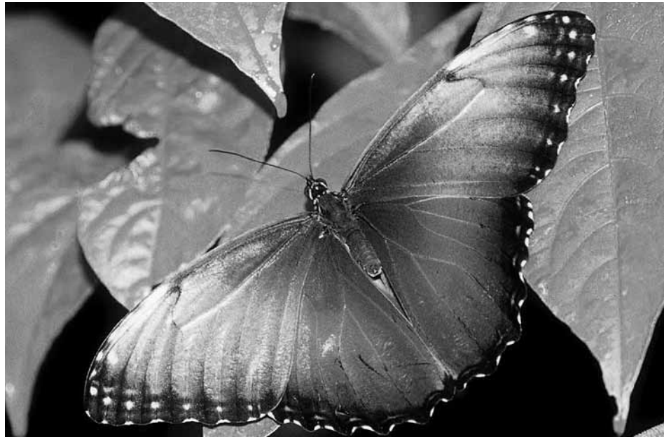
Gnistrande blå. Bland de 250 olika fjärilsarterna finns skönheter i alla regnbågens färger. Denna Blå Morpbo kommer från Sydamerika.

Fjärilshuset blev omedelbart ett omtyckt besöksmål. Med tiden blev arbetet med de många fjärilshusen alltför betungande och 2007 såldes Haga-