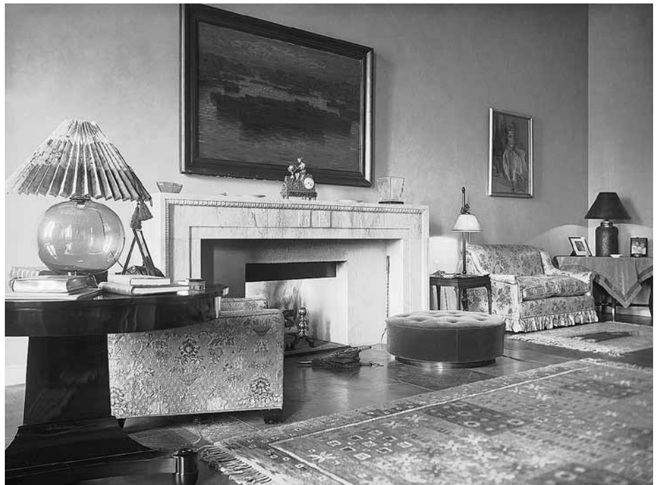
Stora salongen på Haga slott gjordes om till vardagsrum inför prinsparet Gustaf Adolf och Sibyllas inflyttning 1932. Slottsarkitekten Ragnar Hjorth har ritat den stramt funktionalistiska spisen. På golvet en tidstypisk så kallad pöl, en rund mjukt stoppad kudde, där man kunde njuta av brasan, samt en matta från Märta Måås Fjetterström. Foto från Husgerådskammaren ca 1940.

i slottssalarna, samtidigt som Hjorth lyfte fram enstaka klassicistiska detaljer från byggnadstiden. Men de få bevarade inslagen i originalinredningen, som dörröverstycken och spegelinramningar, dämpades färgmässigt så att de i det närmaste smälte in i den strama miljön.