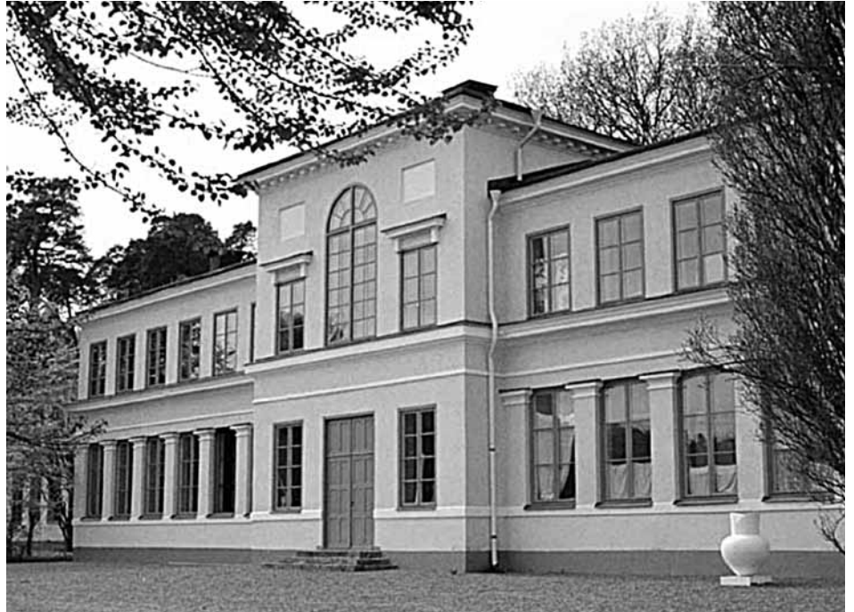
Ursprungligen värdshus, sedan orangeri, numera konstnärateljéer.