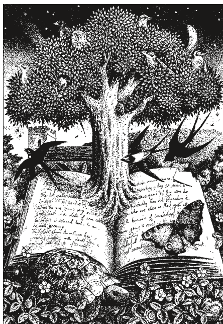
Illustration ur "Vandra i Europas trädgårdar" av Monika Björk. Boken berättar om trädgårdar över hela kontinenten, numrerade från 1 till 100. Bland annat beskrivs Ulriksdals barockpark och Hadrianus Villa utanför Tivoli, nära Rom.

författare till den nyutkomna boken om parker och trädgårdar, berättar och visar bilder. Hamburgerbryggeriets läktarfoajé, Norrtullsgatan 12 N. Färdväg: T-bana till Odenplan.