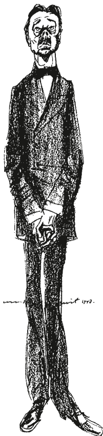
Hjalmar Söderberg, tecknad av Birger Lundquist 1947.

Sommarsöndag. Damm och kvalm överallt, och bara fattigt folk i rörelse.