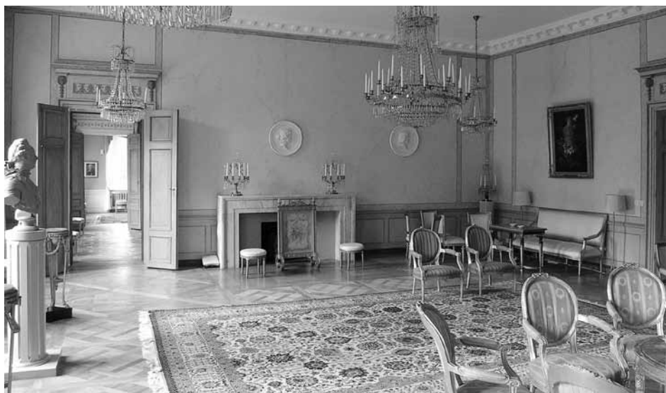
I tre av salongerna i Hage slott finns ståtliga spisar, som skänktes av olika organisationer till prinsparet Gustaf Adolf och Sibylla vid inflyttningen. Spisarna är formgivna i stram funkis av slottsarkitekten Ragnar Hjorth, ansvarig för renoveringen 1932. Foto Statens fastighetsverk 2008.