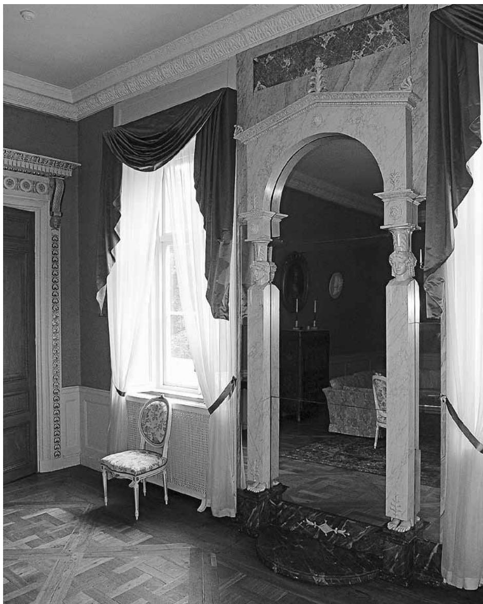
Reflexer från 1800-talet. I paradvåningen på Haga slott finns underbara speglar i empire kvar från tillkomsttiden. Foto Statens fastighetsverk 2008.

Ursula Sjöberg är fil.dr i konstvetenskap. Hon disputerade på en avhandling om Gjørwell och är författare till ett flertal böcker om möbler och inredningar från 1700-1800-talen.