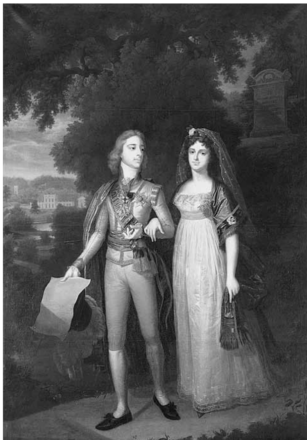
Kungaparet Gustav IV Adolf och Fredrika på promenad i Hagaparken år 1800. I bakgrunden till vänster skymtar Hagapaviljongen, Ekonomibygnaden och Kärlekens tempel. Till höger en sten med inskriptionen "Åt segraren stiftaren konungen fadren", sonens äreminne över Gustav III. Oljemålning av Jonas Forsslund, Gripsholm (Nationalmuseum).

Det var ett bedrägligt lugn. Scenen för Gustav Adolfs och enväldets ödesakt blev som bekant Stockholms slott, där han arresterades av sammansvurna officerare. Men det var på Haga som ödesakten fick sin upptakt. Det var där, den 12 mars vid den middag som gavs med anledning av drottningens födelsedag, som Gustav Adolf sent omsider fick klarhet i att ryktena om Adlersparres och västra arméns uppror och marsch mot Stockholm stämde. Mitt i festligheterna bröt kungen upp och begav sig