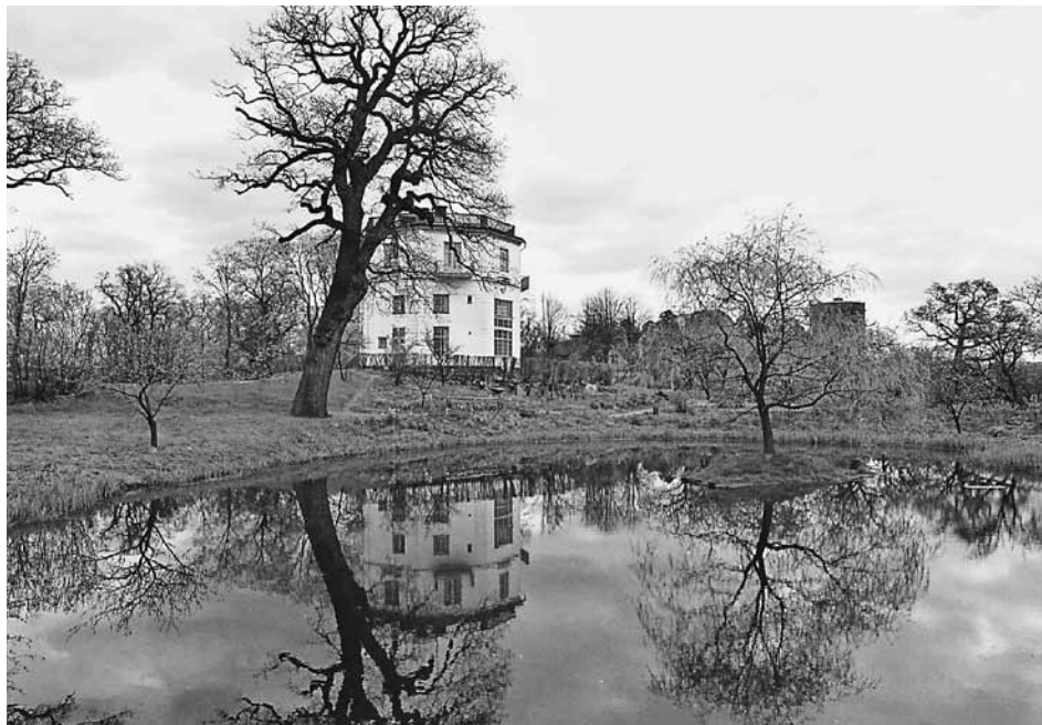
Parken är inte bara park. Stockholms stadsmuseum har kartlagt byggnaderna i Stockholms del av Nationalstadsparken, här Stora Skuggan. Läs mer på sid 3.