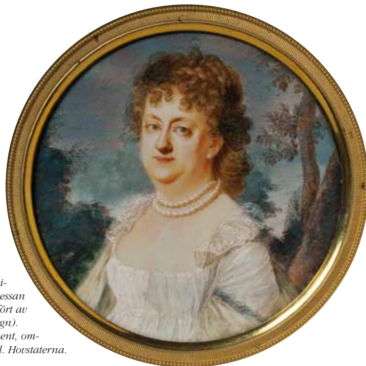
Ett sällan visat miniaturporträtt av prinsessan Sophia Albertina utfört av Domenico Bossi (osign). Gouache på pergament, omkring 1800.

Till slut kom det till någon slags försoning, vilket kan ha att göra med att det hösten 1795 låg i Reuterholms intresse att sluta fred med prinsessan. Det var bara några månader kvar till dess att Sophia Albertinas brorson skulle bli myndig och bestiga tronen som Gustav IV Adolf. Reuterholm var orolig för vad som skulle hända när hertig Karl inte längre fungerade som regent. Men Reuterholms försök till försoning hjälpte inte, för en av Gustav Adolf första åtgärder när han kom till makten var att avpollettera honom.