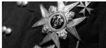
Detaljer av ordenskraschanerna på Armfelts ryska generalsuniform. Se uniformen, tavlor och brev på

Finländaren Gustaf Mauritz Armfelt (1757–1814) har inte behandlats nådigt av den svenska historieskrivningen. På senare tid är han positivt omvärderad, något som kan studeras på den pågående utställningen på Livrustkammaren. Charmören och solskensgossen, berömd för sina amorösa eskapader, uppskattades av kungen och de två blev med tiden nära vänner. Det var