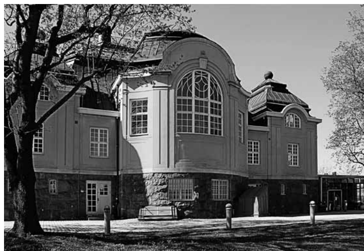
Haga tingshus uppfördes 1905–07. Arkitektfirman Ulrich & Hallquist stod för ritningarna. Långt senare tillkom utbyggnaden i glas på norra sidan.