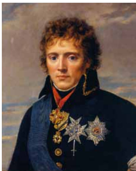
Gustaf Mauritz Armfelt. Porträtt utfört av av den österrikiske konstnären Joseff Grassi 1799.

Till Villa Frescati hör i dag endast den lilla parken runt huset, med en liten fruktträdgård och bärbuskar. Bergianska trädgården anlades 1885, Vetenskapsakademiens väldiga komplex tillkom 1915 och detta i kombination med Roslagsbanan gör att den lilla byggnaden ter sig än mer inklämd och