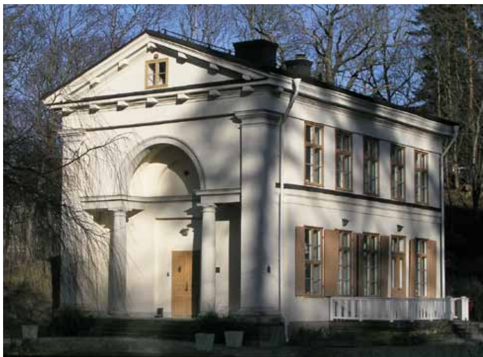
Villa Frescati i kvällsbelysning.

udda. Dock är den i dag lättare att beundra på nära håll tack vare den nya ingången till Bergianska trädgården söderifrån, insprängd i berget intill järnvägen.