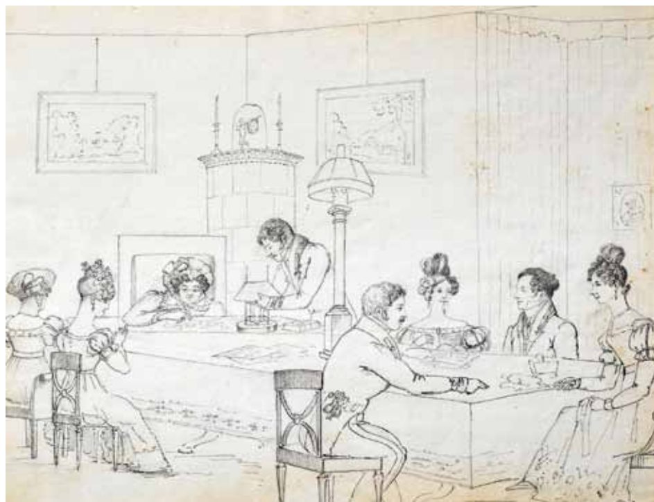
Interiör från Arvfurstens palats 1829. Prinsessan Sophia Albertina sitter och broderar vid korttändan omgiven av sitt hov. Pennteckning av Carl Bennet. Privat ägo.

Hennes hovdam Magdalena Rudenschöld, som denna gång inte följt med sin prinsessa till Tyskland, stod i Stockholm anklagad för landsförräderi. Hon hade lierat sig med sin älskare Gustaf Mauritz Armfelt i hans försök att restaurera den gustavianska politiken. Längre nekade hon till sitt brott, men till sist hann sanningen i kapp henne och hon blev dömd till att förlora liv, ära och gods. På sin svägerskas, hertiginnan Hedvig Elisabeth Charlotta,