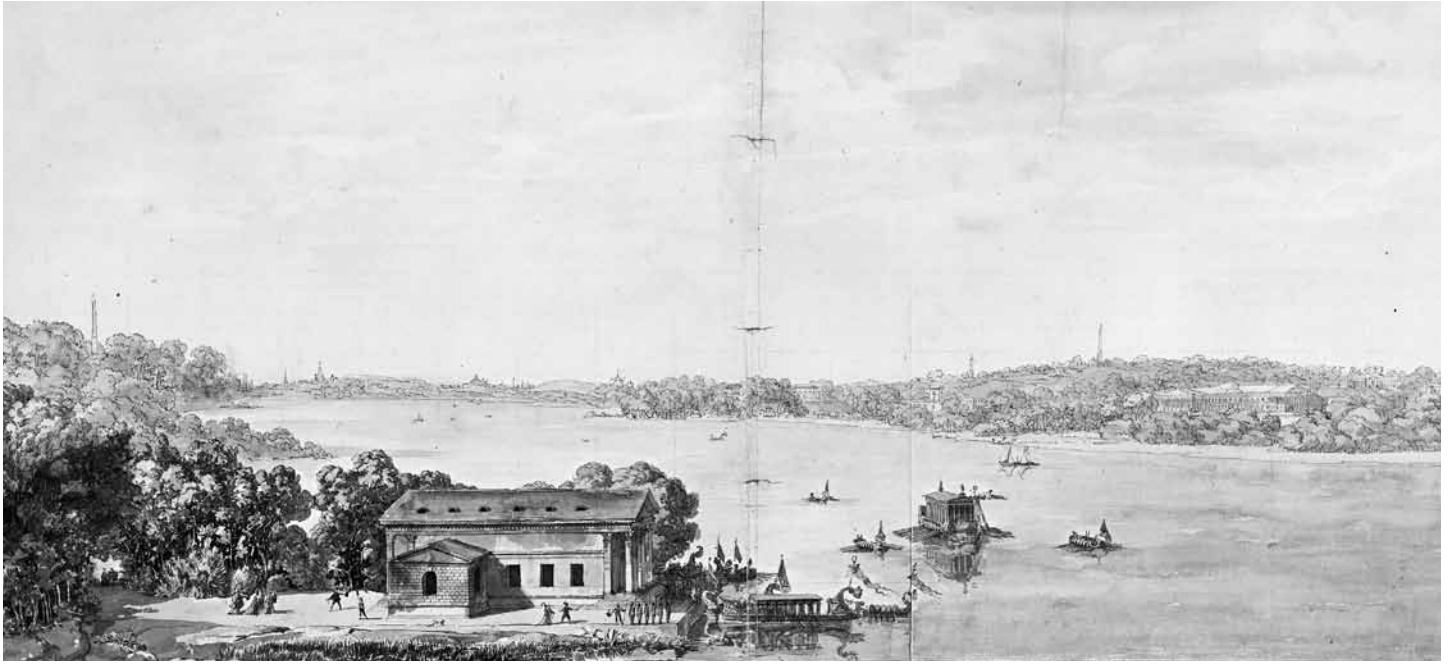
Louis Jean Desprez , panorama över Brunnsviken. En av flera skisser av Desprez som visar de många tänkta byggnaderna runt Brunnsviken. Närmast i bild syns en variant av Armfelts villa. Nationalmuseum. Se även "Haga – ett kungligt kulturarv", Votum förlag, 2009.

han upphöjdes snart och blev konungens favoritarkitekt i skarp konkurrens med flera andra av tidens arkitekter. Desprez har bl.a. gjort ritningarna till Koppartälten i Haga, som i sin teatrala framtoning verkligen låter oss ana en kulissmålare!