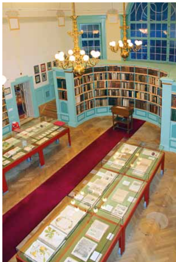
Den gamla rättegångssalen i Haga tingshus, numera hem för Hagströmerbiblioteket, Karolinska Institutets specialbibliotek för medicinhistoria.

Under arbetet med grunden upptäcktes en jättegryta från istiden, 3 meter djup och 90 centimeter i diameter. Den är en av de största i sitt slag i Stockholmsområdet. Geologen Gerard De Geer såg till att den bevarades och den kan >>>