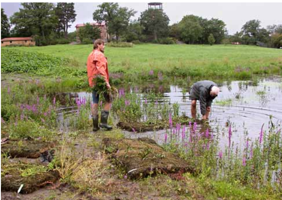
Arbete pågår. Höga gummistövar och uppkavlade byxben är ett måste när vattenväxter ska banteras.