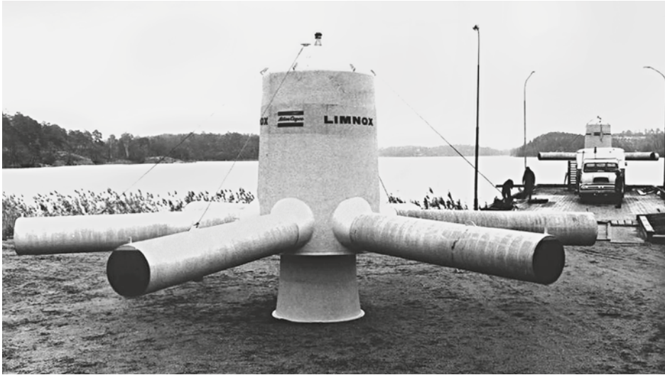
En av de Limno-luftare som användes i Brunnsviken 1973–81. Vatten drogs med tryckluft in i öppningen nertill och det syrsatta vattnet strömmade ut genom de horisontella rören.

»»» Den första koleraepidemin drabbade Stockholm 1834 och följdes sedan av flera, den största 1853. I mitten av 1800-talet började man ana sambandet mellan kolera och vattenburna föroreningar. Stora Träsket pekades ut som ett av de mest förorenade vattnen. Brunnsviken var kanske inte så mycket bättre – i Hyrkuskens berättelser, som August Blanche skrev omkring 1860, berättas hur den blivande hyrkusken vill imponera på en ung dam, men det fanns gränser: ”Ett ord av er, mamsell, och jag störtar mig på ögonblicket i den brusande skummande vågen! ... jag ska störta mig i Mälaren eller Saltsjön, vilketdera ni vill, dyrkade flicka! ... men begär inte att jag kastar mig i Brunnsvikens stillastående vatten, där vågen är som grönsoppa och där fisken simmar död mot strand.”