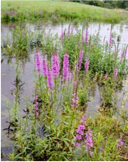
Fackelblomster trivs i den blöta jorden och lockar fåglar och insekter.

»»» när den tiden kom sprakade stränderna i lila och purpur. Så kan det gå när en gammal fröbank aktiveras! Mindre angenämt var att även kaveldunet visat sig motståndskraftigt – en stilig planta men med mängder av frön i sin pampiga batong. Fanns inget annat att göra för Åke och hans medhjälpare än att klä sig i badbyxor och klafsande i leran gräva upp planta för planta. Samtidigt drog man upp en och annan vassplanta, som inte heller uppskattats i ängsmark.