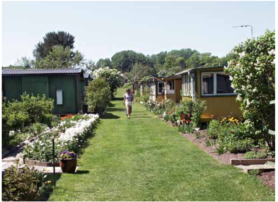
Slätklippta gräsmattor och välansade rabatter i Kvarnureten koloniområde vid Ulriksdal.

Anna Lindhagen fick staden att upplåta mark och därmed var koloniverksamheten i gång. Det allra första området anlades vid Värtan 1903, men finns inte längre kvar. Sen kom Söderbrunn 1905, som ligger på Norra Djur-