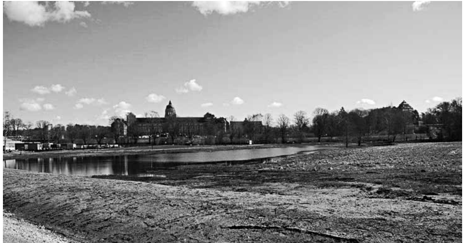
På Bergianska trädgårdens marker söder om Edvard Andersons växthus har den nya våtmarken anlagts, här med Naturhistoriska riksmuseet som fond.

Det var när SL beslöt sig för att flytta tågstationen som det började hända saker. Och det gick fort! Bergianska trädgården tog kontakt med SL och tillsammans med Statens Fastighetsverk