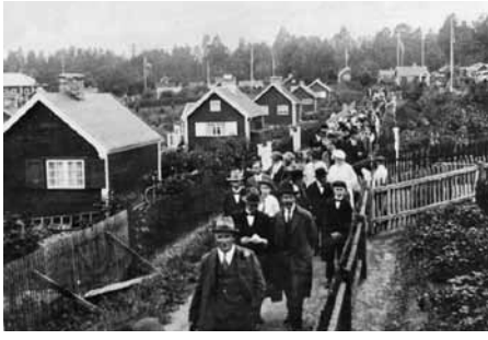
En angelägenhet för hög som låg. Bergshama koloniförening på Tivoli udde får besök av jordbruksminister David Petterson 1923.