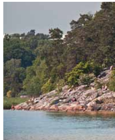
Brunnsvikens östra strand, med badvänliga klippor.

Hagadagen arrangeras i år söndagen den 29 maj. Program finns från mitten av maj på vår hemsida och delas ut på plats. Se vidare sidan 8. Väl mött!