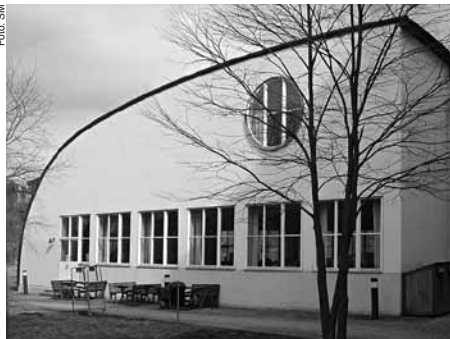
Sveaplans läroverk , med den karakteristiska aulan och Brunnsviken inom räckbåll.