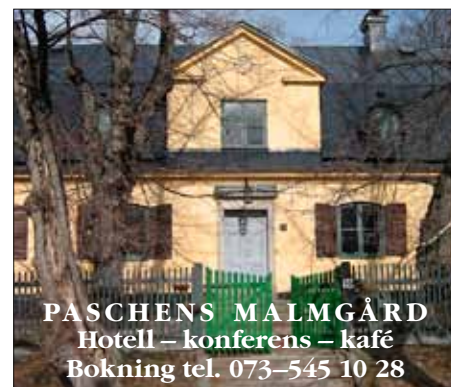
PASCHENS MALMGÅRD Hotell – konferens – kafé Bokning tel. 073-545 10 28

ölj vännerna på Facebook! Sedan en tid tillbaka kan man skaffa sig information om Haga-Brunnsvikens vänner även denna väg. Enklast hittar du dit genom att gå in på föreningens vanliga hemsida. Adressen dit är som alltid: www.haga-brunnsviken.org