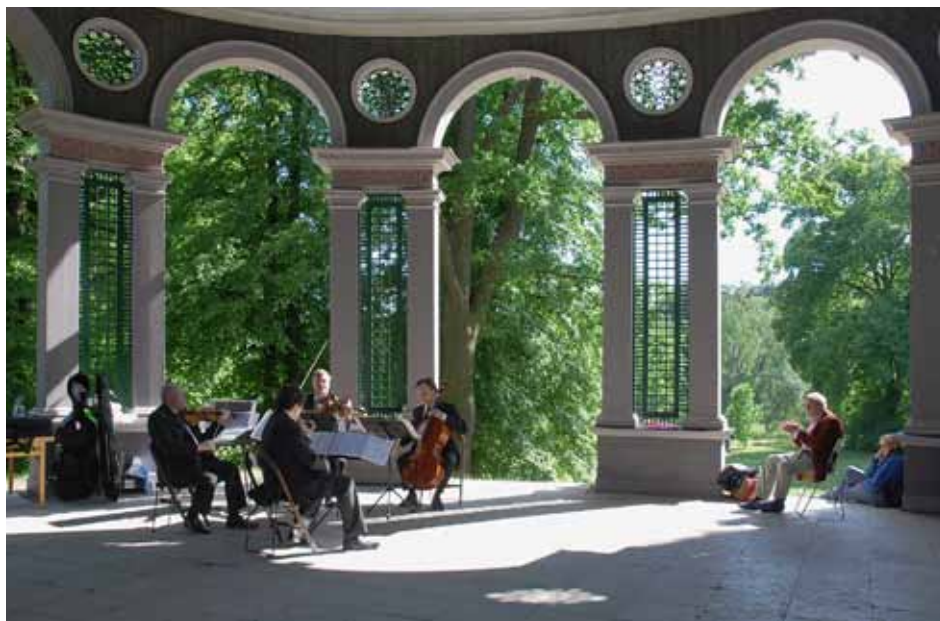
Ekotemplet, plats för musikupplevelse under Hagadagen.

Plats: Paschens Malmgård, Bellevue. Anmälan och avgift se: www.haga-brunnsviken.org