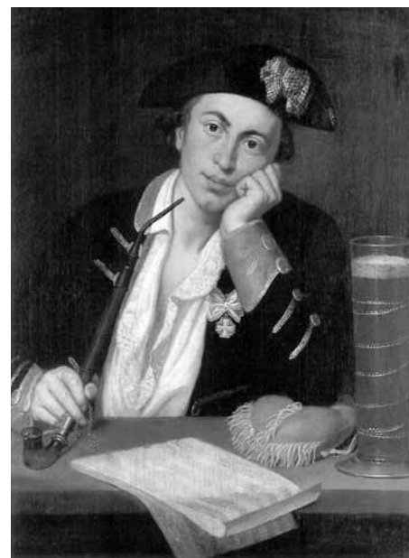
Joseph Martin Kraus , kompositören som verkade under Gustav III och ligger begravd vid Brunnsvikens strand. I år firas Kraus' 250-årsjubileum. Porträtt målat i Erfurt 1775 av okänd konstnär.

Kraus föddes i Miltenberg, i det natursköna Odenwald som ligger sydost om Frankfurt, hans far var ”Amtskeller” (ungefär motsvarande drätseldirektör) i kurfurstendömet Mainz, och Joseph fick en god och påkostad utbildning, först vid jesuitgymnasiet i Mannheim, där lägligt nog världens då ”bästa” symfoniorkester verkade och han utöver skolpluggen kunde få den bästa musikutbildning. Sedan följde, förmodligen på faderns order, juridikstudier i Erfurt (där påpassligt nog en Bachelev var domorganist) och särskilt i Tysklands då namnkunnigaste juridikuniversitet Göttingen. Musiken fick här enligt breven hem en smutt grotesk studentikos prägel, men ett annat avgörande intryck blev det långsamt borttynande litterära kottteri som fått fast fot i tysk litteratur,