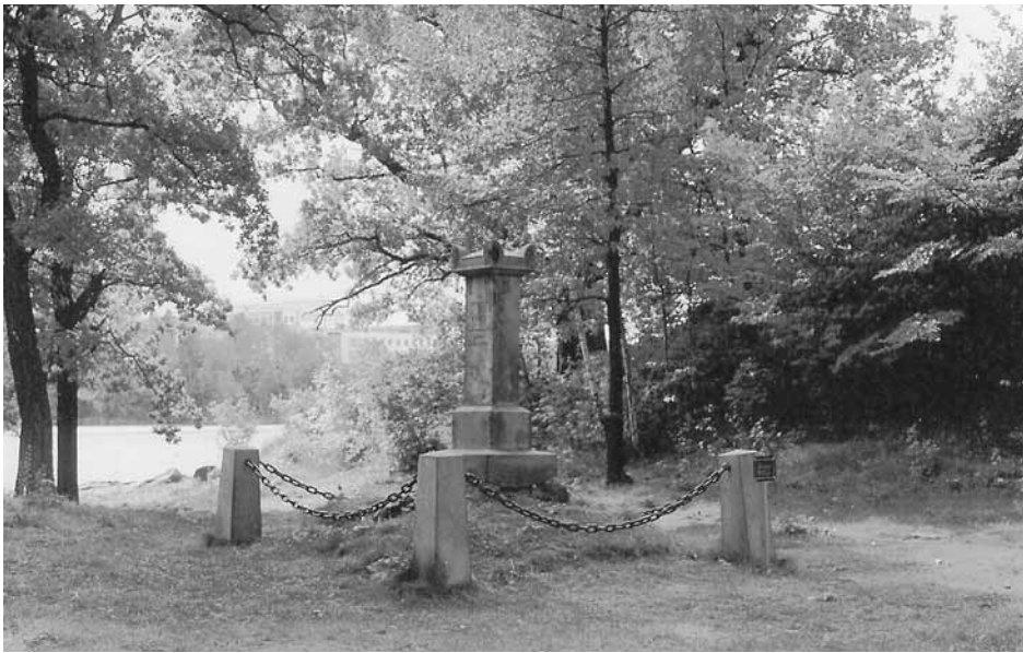
Kraus grav på Tivoliudden vid Brunnsviken. Nedan detalj med inskriptionen.

►►► musikaliskt, eftersom mycket av det som gjort Kraus till den storslagna tonsättare han strax blev har något av Sturm-und-Drang som grundprägel.