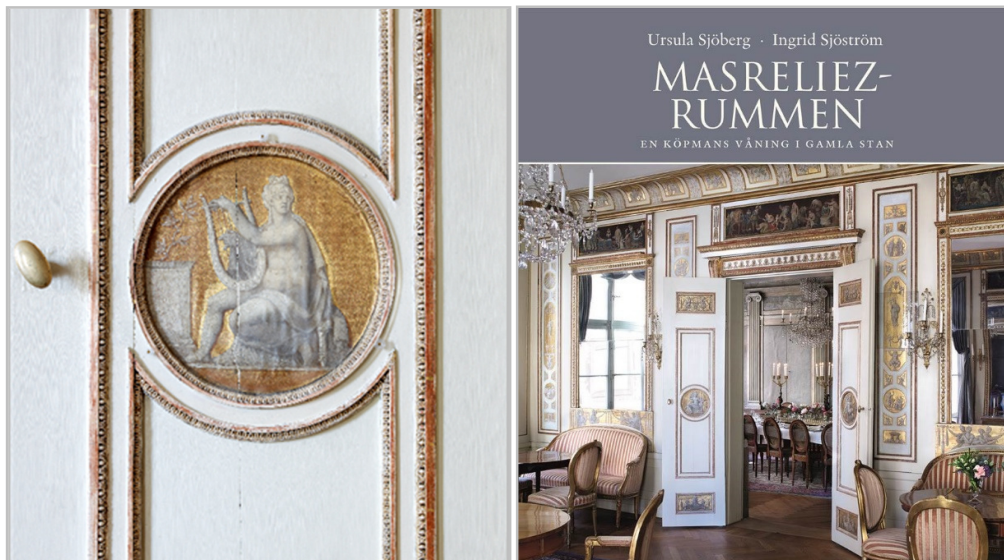
Apollo, mittspegel i dörr i salongen, Masreliézrummen i Gamla stan. Ur boken "Masreliézrummen. En köpmans våning i Gamla stan".

De tre rummen har olika karaktär. Rikast utsmyckad är Salongen, där också scener ur Gustav II Adolfs historia finns som överstycken. De antika gudomligheterna pryder väggfält och dörrspeglar. Även här hittar vi paret Apollo och Minerva, i medaljonger på salongens dörrar mot matsalen. Här sitter Apollo med sin lyra, säkert för att betona de kulturella samkväm som äger rum i våningen.