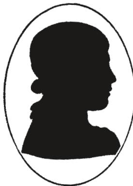
Joseph Martin Kraus 1756–92.

Ordinarie årsmötesförhandlingar med stadgeenliga ärenden: verksamhetsberättelse, ekonomisk redogörelse, revisionsberättelse, fråga om ansvarsfrihet, val av styrelse, revisorer och valberedning – med mera. Föredragningslista och övriga aktuella handlingar delas ut vid mötet.