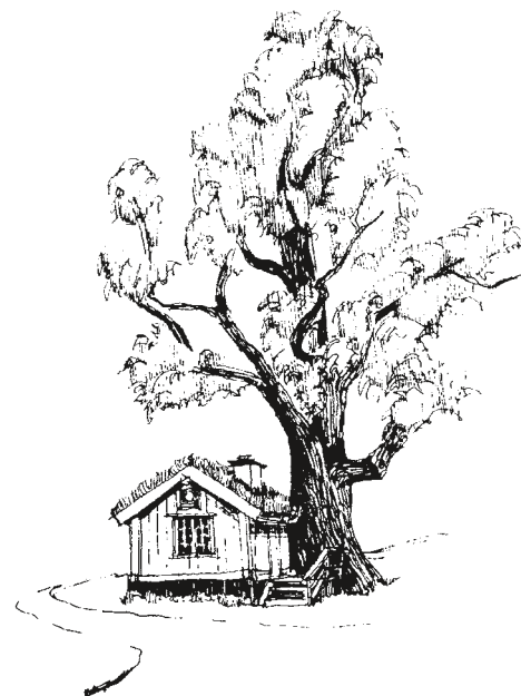
Karl XI:s fiskarstuga. Snart granne med stads kvarter med 7-våningsbus – eller ett naturanpassat byggande i friluftslivets tecken? Illustration i Förbundet för Ekoparkens programskrift från år 2000: "Värna · Vårda · Visa", av M. Eriksson.

I förra numret av Hagabladet redovisades Haga-Brunnsvikens vänners kritiska ståndpunkter i detta ärende.