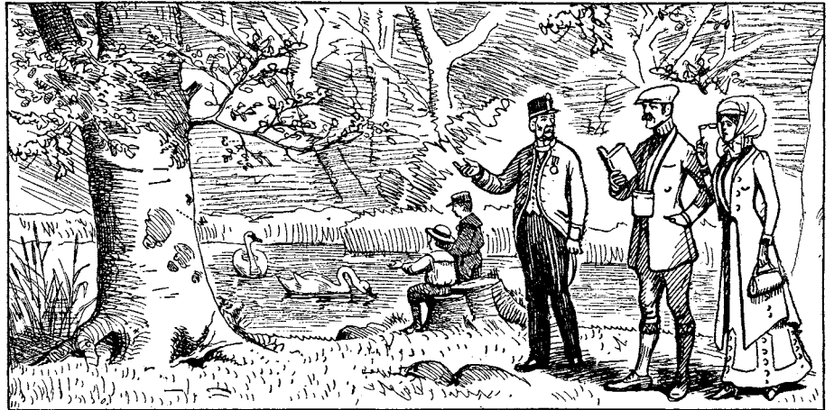
Bild: dokument nr "Un musee" och "Le bois", T. G. Goldschmidt, Franske. Bilke-Göser, 1920.

DN-artikeln är skriven med anledning av att Vägverket nu planerar att bygga en motorled över Lovön i Mälaren och en ny riksväg över det mäktiga älvlandskapet i Trollhättan. Naturvårdsverket har inte tagit ställning till dessa planer men den av regeringen tillsatta utredningen om ytterligare nationalstadsparker, ledd av den förre kulturministern Bengt Göransson, föreslog den 26 mars 1996 att bland annat älv-