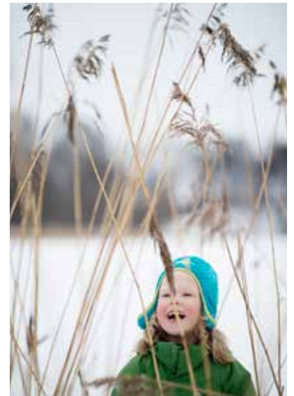
● Glädje bland vassvippen.

Ett stycke norr om Hagaparken ligger Ulriksdal med slott och park och handelsträdgård. Haga-Brunnsvikens vänner inleder nu ett samarbete med den anrika grannen, som presenteras sist i numret. Som vanligt innehåller årets första nummer även föreningens verksamhetsberättelse, som påminner om alla lyckade evenemang det gångna året.