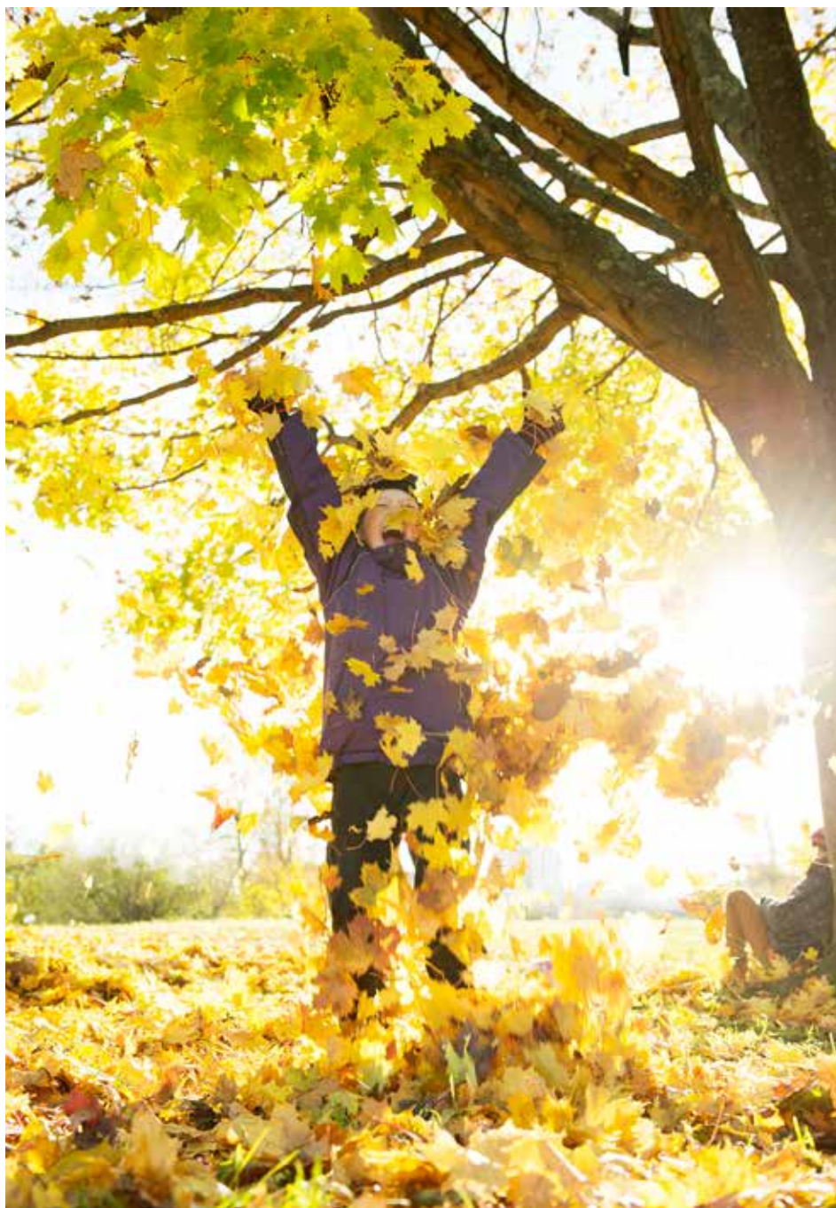
Varje årstid har sin tjusning i Haga – vad bräcker höstens färgkaskader?

– Norrmalm har minst andel parkyta per invånare och med två nya ex-