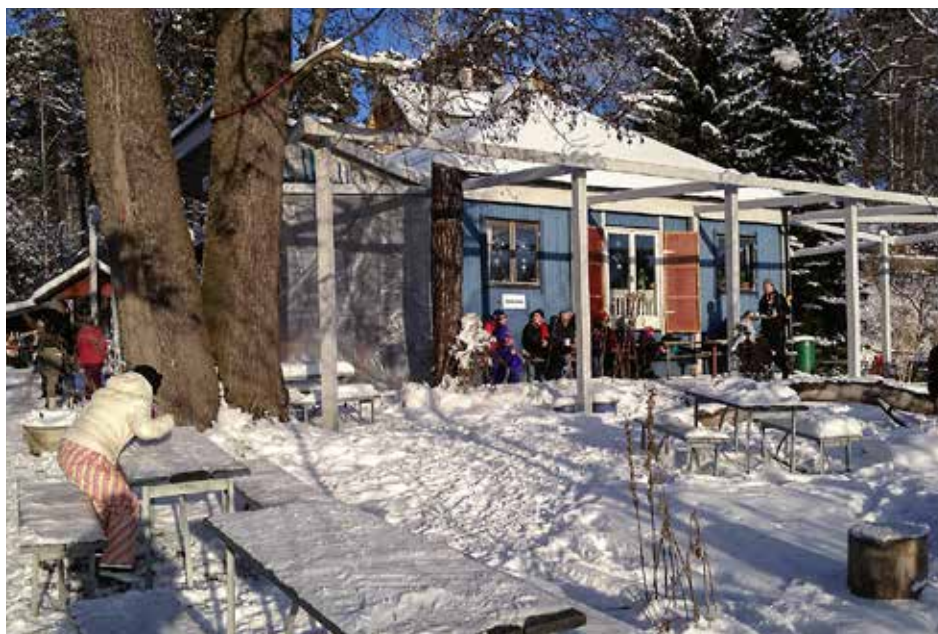
Kafé Sjöstugan så som det ter sig för besökare som kommer över sjön. Den blå färgen är ett minne från husets förflutna som byggfutt.

Källa: "Friluftsutnyttjande av tre stadsnära skogar kring Uppsala 1988–2007" av Lars Kardell, SLU.