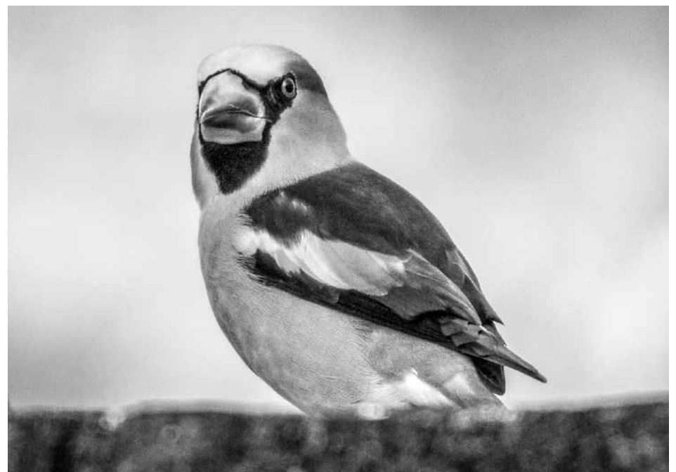
Stenknäcken med sin nötknäpparnäbb.

Det är vadarhonorna hos skogs-snäpporna som är först. Det finns inga bra rastplatser vid Brunnsviken så sommarens vadarsträck flyger över ganska obemärkt. När dagsträckande småfåglar börjar komma i gång kan man dock få fina sträckmorgnar uppe