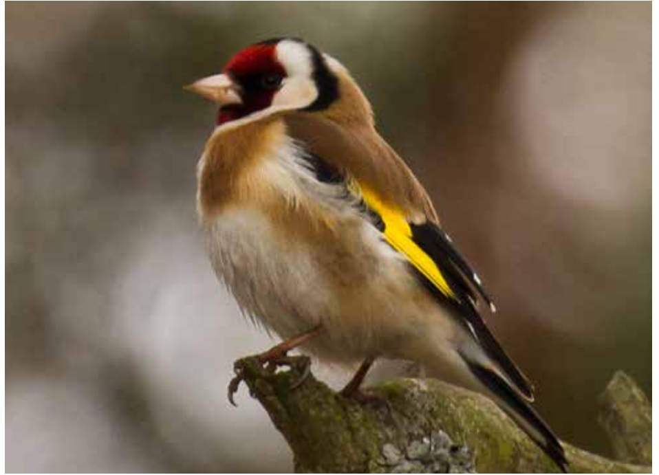
Den brokiga steglitsen, som Gud torkade av penslarna på när han färglagt alla de andra fåglarna.

"Det övergripande syftet med inventeringen är att kartlägga ornitologiska kvaliteter som kan utgöra planeringsunderlag och indirekt hjälpa till att säkra Djurgårdsmarken från exploatering. På sikt bör de kungliga markerna Djurgården-Haga/Brunnsviken-Ulriksdal kunna betraktas som