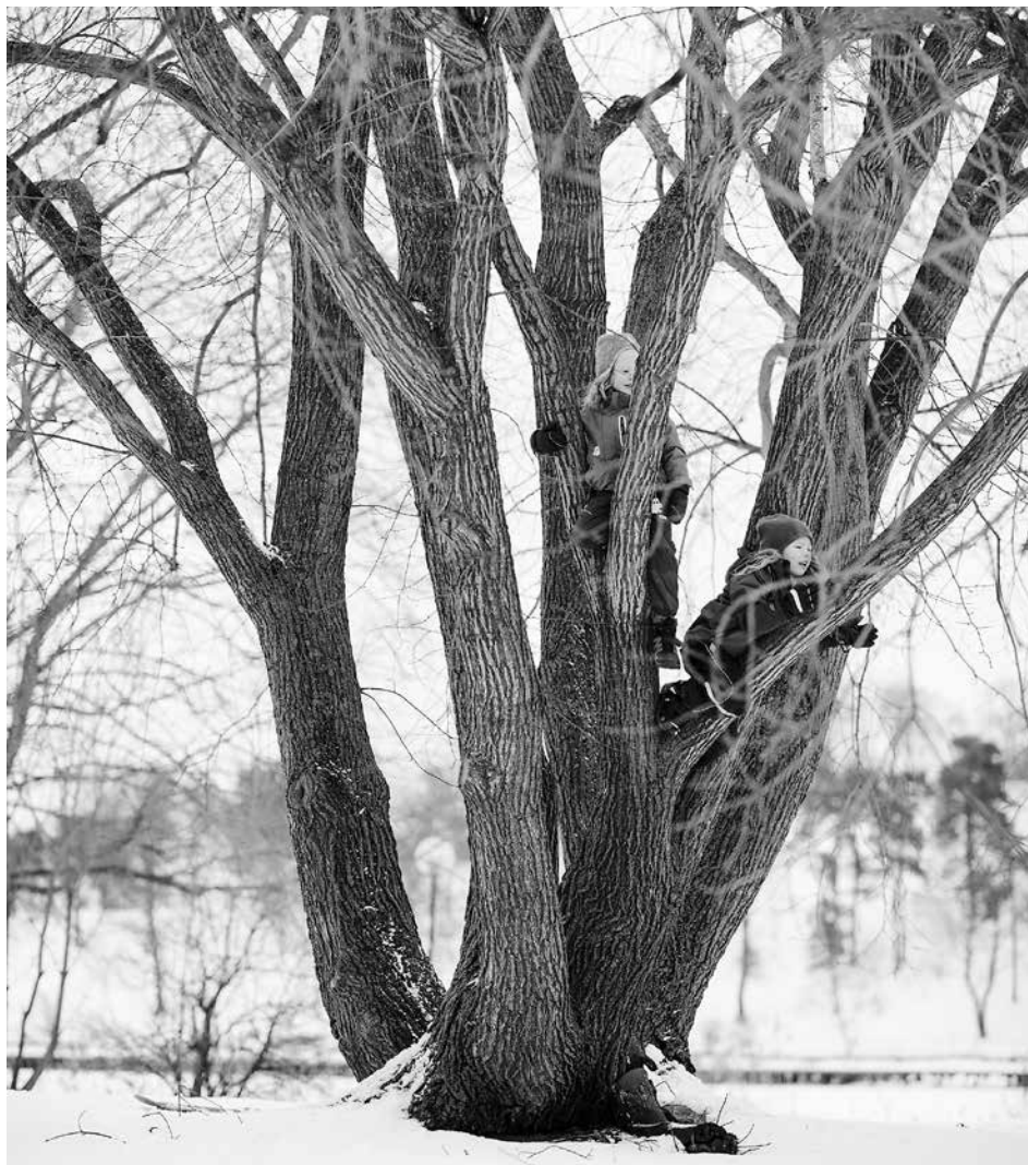
Överallt i parken står fina klätterträd, lockande för både barn och fåglar.