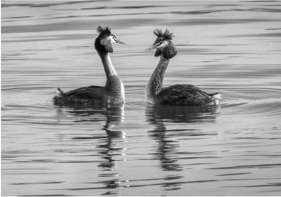
Skäggdoppingparet spelar i Brunnsviken.

»»» att jag guidat hundratals båturer på Brunnsviken och lett otaliga exkursioner längs stränderna så är Kungliga nationalstadsparkens (Ekoparken) natur- och kulturvärden fortfarande okända för många. För en initierad läsekrets som Hagabladets kanske denna orientering om fågellivet kan ge en del ny kunskap om arter och lokaler.